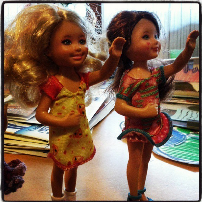
Le testimoni al processo Ruby manifestano simpatie politiche inequivocabili...