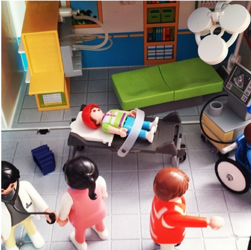
Il sistema sanitario più efficiente d'Europa