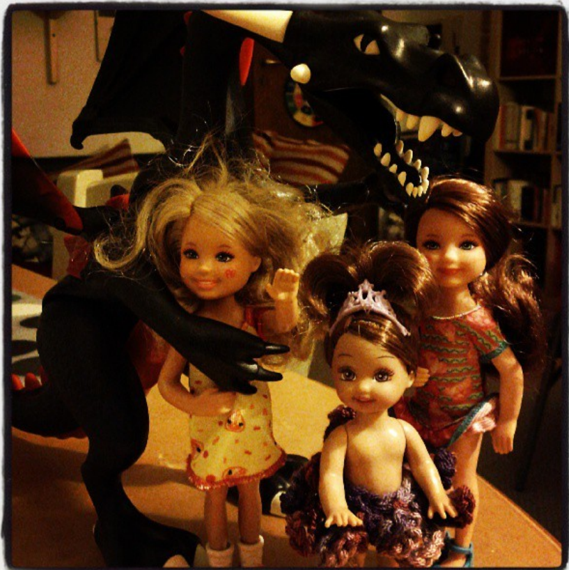
Il "Processo Ruby" (o "Le vergini al Drago", o "Il dissoluto punito")