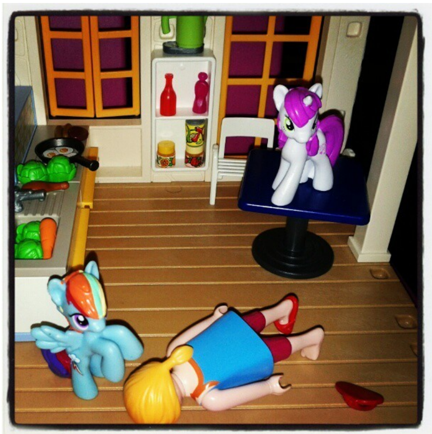
I mini mini -pony assassini: occupano case e sconfiggono i playmobil residenti