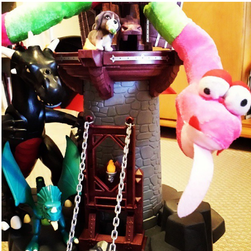
Riunione a Palazzo Grazioli, sulla possibile candidatura della Pitonessa...