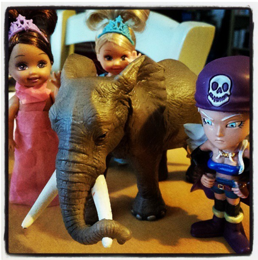
Giuliano Ferrara manifesta in piazza. Si riconosce nella folla la fidanzata di Berlusconi.